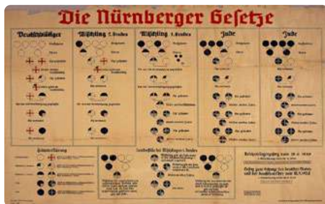
Tableau racial des lois de Nuremberg de 1935.

à des Juifs sont pillées et saccagées. Près de 30 000 Juifs sont arrêtés et envoyés dans des camps de concentration.