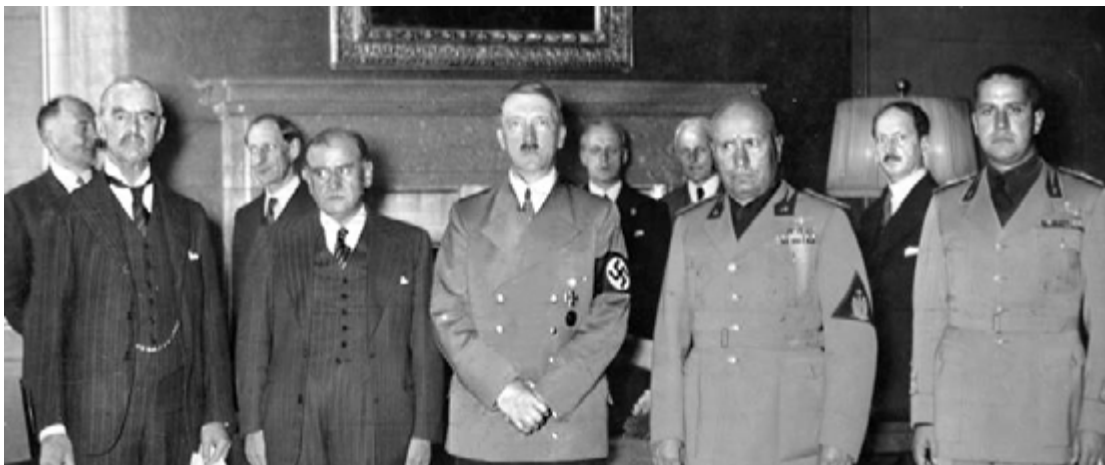
Chamberlain, Daladier, Hitler et Mussolini (avec à sa gauche son ministre Ciano), le 29 septembre 1938 à Munich